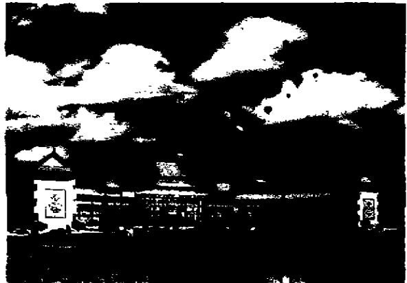
图2 白云湖主大门及其广场

在步行街的设计中,则采用了西部地区传统民居中的吊脚楼、穿斗结构、傣族竹楼、硬山、歇山等传统的建筑语汇为基本形式,以布局自由的传统集镇为模式,围合成一条200多米长的集游人购物、用餐、观看社戏等室内外活动于一体的使人轻松随意的步行街。街道与建筑的宽高比基本为1:1,路面铺着当地的青石板,两旁的建筑每隔十开间左右都设开敞的可欣赏外面景色的休息空间,在吵吵闹闹的步行街集市中,又增加了几分休闲的气氛,这也得益于传统建筑的启发(如图2)。