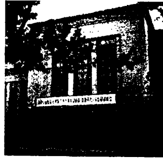
图 6 南京国民大会堂