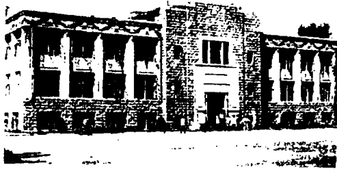
图 5 吉林大学教学楼