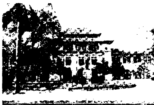
图1 厦门大学“群贤楼”