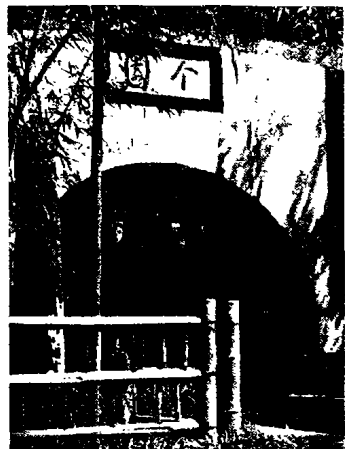
图8 扬州个园之写意