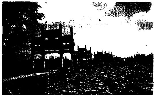
图5 歙县·牌坊群

化,在世界上是独一无二的。我们在进行景观规划设计过程中,应该尊重与利用这种传统,去伪存真,努力营造最符合中国人理想的环境景观。