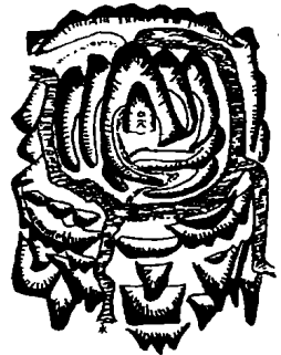
图2 风水说理想的景观格局 (源自:俞孔坚《景观:文化、生态与感知》)