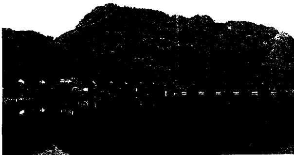
图4 黟县屏山·风水桥 (源自:王振忠,李玉祥《乡土中国·徽州》)