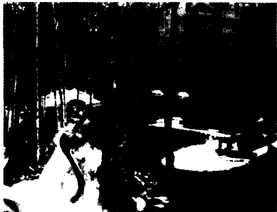
图2 长春威尼斯花园的组团环境

社区规划还可考虑修建一些老年公寓,供子女不在身边或愿意独居的老年人居住。公寓层数宜在四层以下,公寓室外环境宜安静,有相当面积的绿化及活动场所,建筑设施设备完全适应老年人的特殊需求,必要时还可提供安全协助和简单的医疗设施(如图4)。