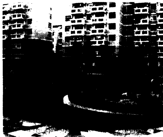
图3 儿童游戏场也可供老人使用